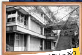
豆知識：現在も4号館の一部は書庫として使用されています。

蔵書と利用者数の増加を受け、 1968(昭和43)年 には四階建の 新しい図書館 が建設されます。防火・消火装置や暖房換気などの近代的設備を完備したその建物は、現在の 4号館 です。