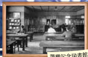
澤柳記念図書館内部