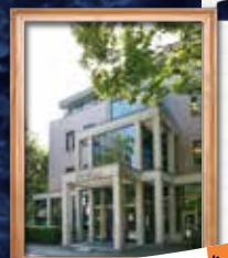
豆知識：建築賞を受賞した 瀟洒なデザイン。

皆さんが利用している 現図書館 が新築され開館したのは、 1989(平成元)年11月6日 になります。開架書庫スペースの拡大や、AVホール等設備の充実が目を見事にトップライトからの自然光がやさしく包み込む、 落ち着いた雰囲気 が特徴です。