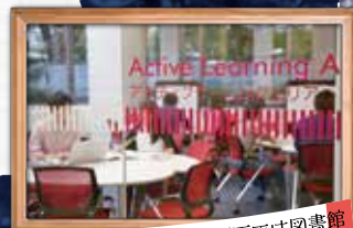
千エック：エリア内の大画面では図書館からの最新のお知らせが確認できます