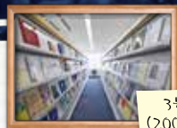
3号館雑誌室 (2007年オープン)